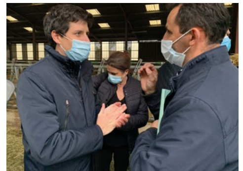
Rencontre avec M. le Ministre de l'Agriculture lors de sa venue dans le Puy-de-Dôme, le 16 octobre dernier.

Sur les prix, les outils législatifs issus des États Généraux de l'Alimentation doivent permettre un rééquilibrage des rapports de force commerciaux,